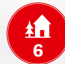
Farfuglaheimili og Hostel